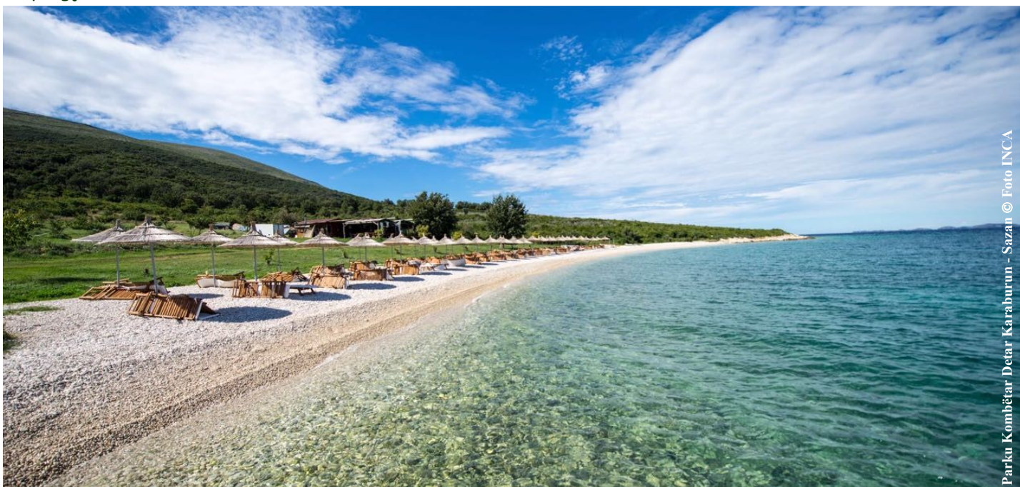
Parku Kombëtar Detar Karaburun - Sazan

Aktualisht, për këtë park ka përfunduar dhe është miratuar, me urdhërin nr. 750, datë 24.11.2015 të Ministrit të Mjedisit, plani i menaxhimit, i përgatitur nga INCA, me mbështetje të UNDP, ku janë zhvilluar një gamë e gjerë veprimtarish.