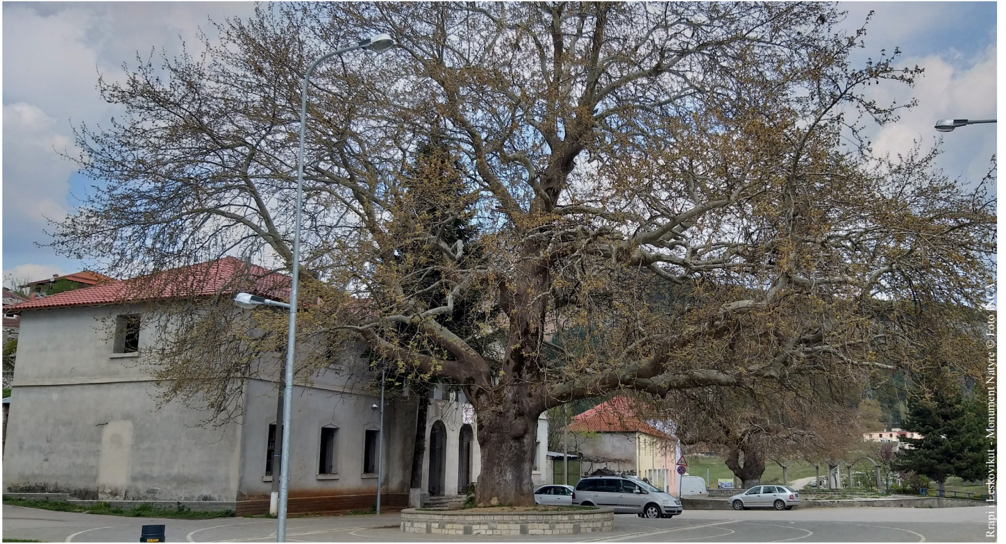
Rrapi Leskovikut - Monument Nature