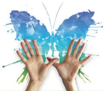
Natura 2000 DAY

Dita Evropiane e Natura 2000 lidhet me 21 Majin e vitit 1992, kur u aprovuan së bashku Direktiva e Habitave të BE dhe Programi LIFE. Kjo Direktivë së bashku me atë të