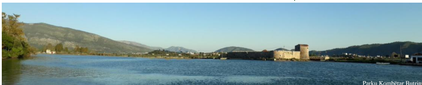
Parku Kombëtar Butrint

disa shtesa dhe ndryshime në VKM nr. 693, datë 10.11.2005, të Këshillit të Ministrave "Për shpalljen e kompleksit ligatinor të Butrintit Park Kombëtar", të ndryshuar.