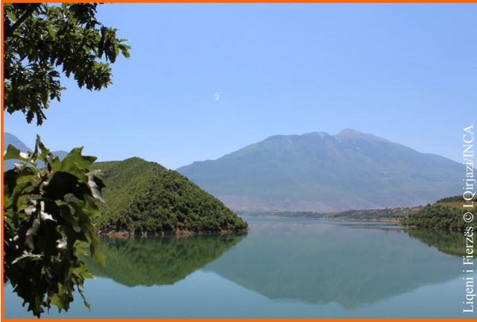
Liqeni i Fierzës

Kukës 13 Qershor 2015 - Në qytetin e Kukësit në kuadër të projektit “Zhvillimi i turizmit të qëndrueshëm dhe menaxhimi i Zonave të Mbrojtura” dhe të aktiviteteve të Rrjetit për Mbrojtjen e Natyrës, që mbështetet nga projekti SENiOR-A, nëprmetj REC-