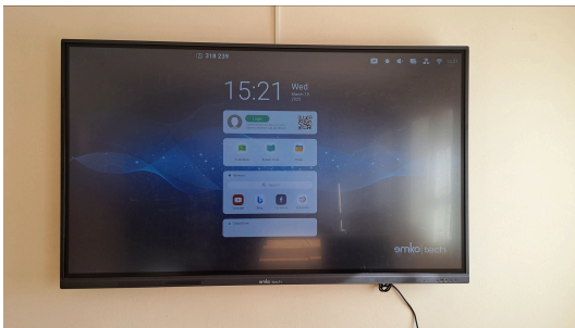
Tabela interaktive në shkollën Ibrahim Gjorgji Radimirë