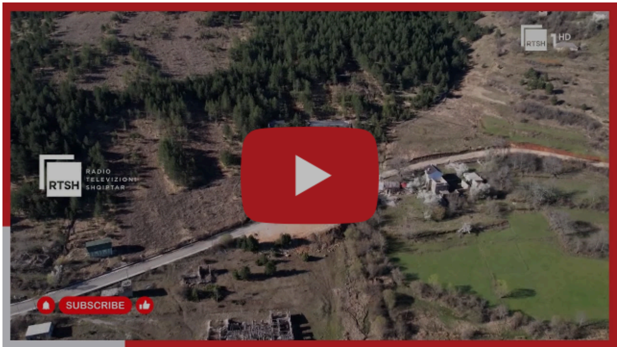
Lura, porta e hapur e turizmit malor - Turizmi i aventurës në liqenet akullnajore