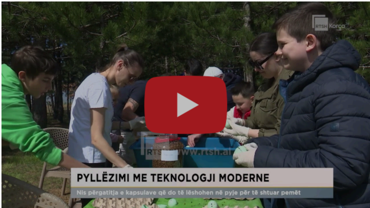
Pyllëzimi me teknologji moderne/nis përgatitja e kapsulave që do të lëshohen në pyje