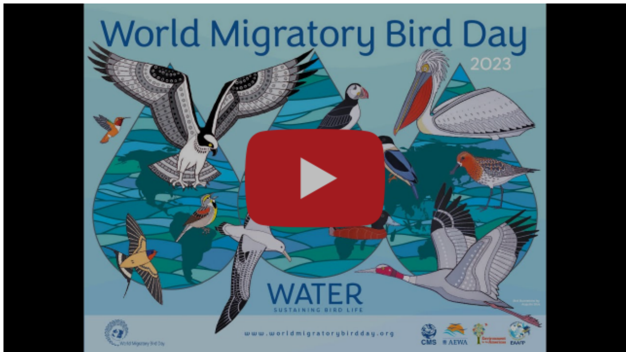
Water: Sustaining Bird Life