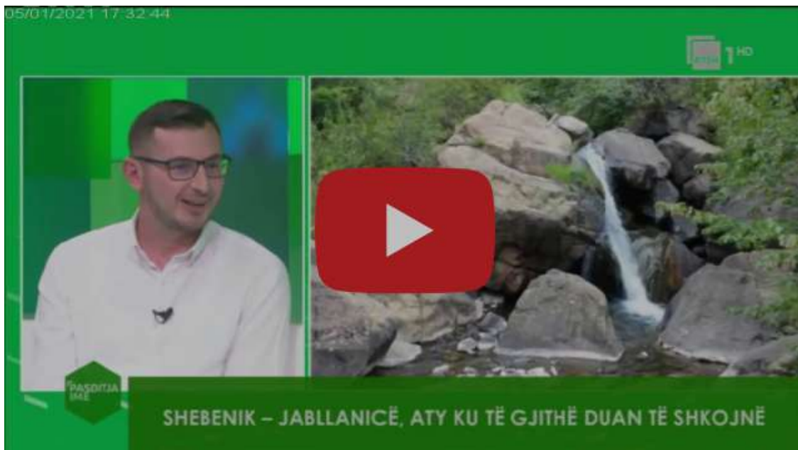
Shebenik - Jabllanicë, aty ku të gjithë duan të shkojnë