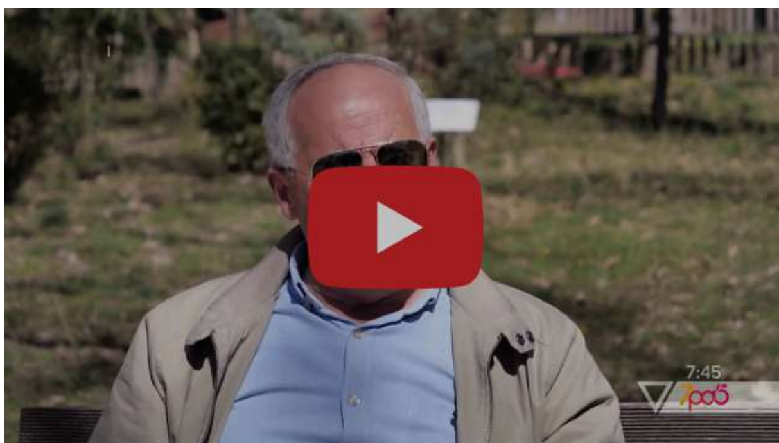
Sa e pasur është bota e egër në Shqipëri?